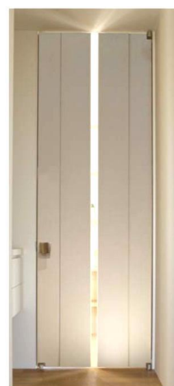
【ガラス戸イメージ】