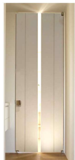
【ガラス戸イメージ】